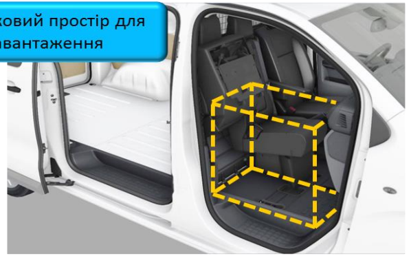
Додатковий простір для завантаження